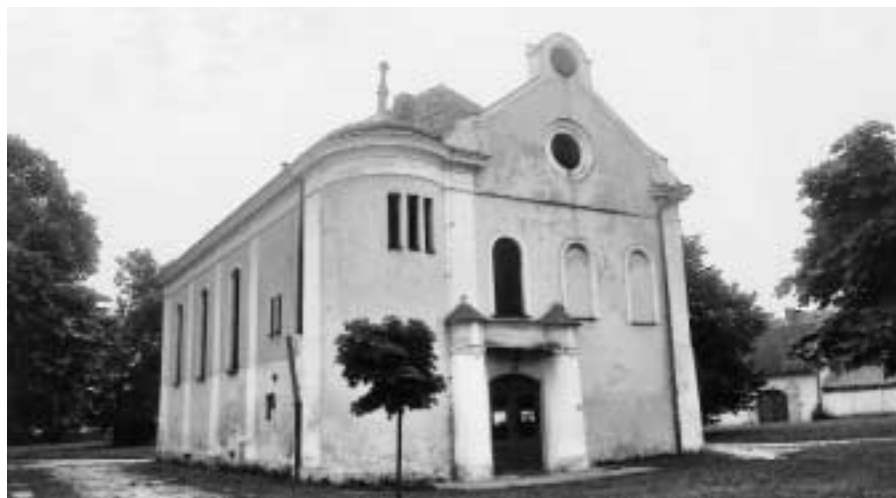
Synagogu v Novém Bydžově dnes využívají evangelíci jako modlitebnu