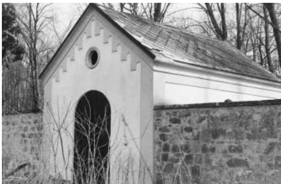
Márnice na jičínském hřbitově

Synagoga v Tovární ulici, severně od náměstí, byla postavena v letech 1726–1729 jako dřevěná, v letech 1765–1767 byla postavena nová, zděná synagogální budova. Po požáru r. 1859 byla opravena v novoro-