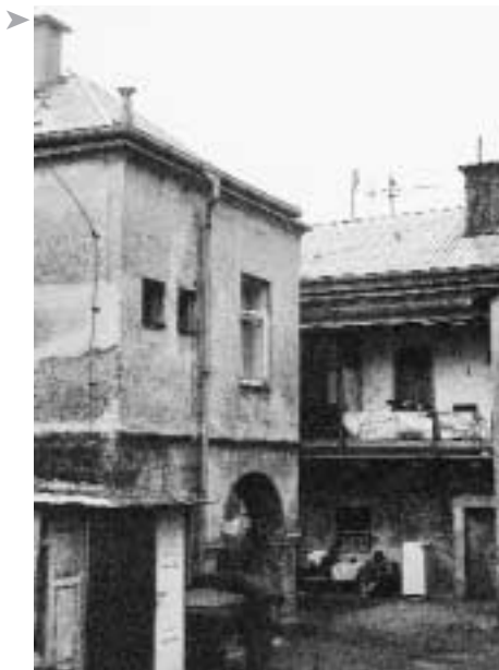
V Hořicích se zachovala i část domů židovského ghetta

mánskému slouhu. V 80. letech 19. století byla zřízena nová ženská galerie, poslední větší renovace proběhla r. 1902. Poslední židovské bohoslužby se v synagoze konaly v polovině 30. let 20. století. Po druhé světové válce zůstala 7 let opuštěná, od r. 1952 dodnes je využívána Církví československou husitskou k bohoslužebným účelům. V sousedním domě bývala od konce 18. století do 80. let 19. století židovská škola s bytem rabína, v letech 1882–1898 škola sídlila v domě čp. 167 na náměstí. Klíče od synagogy jsou uloženy v městském muzeu.