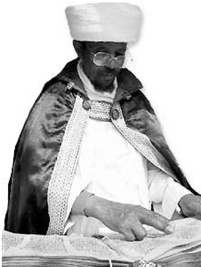
„KIDUŠ NA PRVNÍ A SEDMÝ DEN SVÁTKU PESACH“