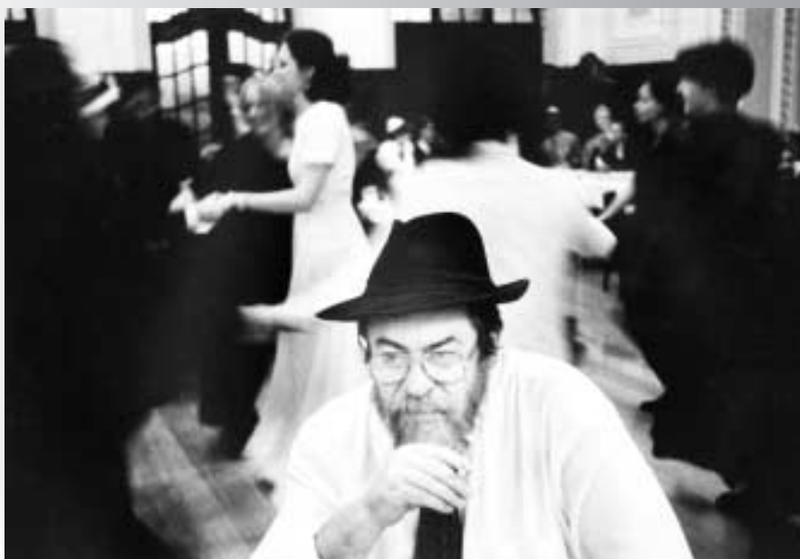
Fotografie z Prahy a Ukrajiny Karel Cudlín (počátek 90. let)