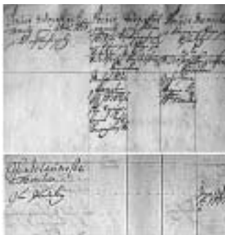
„Počet židovských familij jenž v letu 1618 se tu vynacházely / Počet židovských familij jenž po letu 1618 se tu vynacházely a v kterých roce se sadily / Počet manželů v kterým roce se sadily.“ – Ne vždy byly Soupisy sepsány v češtině, jako je tomu v ukázce ze Soupisu židovských rodin v Kolíně nad Labem, 1724.

V době, k níž se vážou Soupisy a Knihy familiantů, byla země rozdělena na 16 krajů v Čechách a 8 krajů na Moravě. Soupisy a Knihy familiantů byly vedeny poněkud odlišně v Čechách a na Moravě. Pro badatele je podstatné vědět, že dokumenty z Čech jsou centrálně uloženy v Národním archivu v Praze, zatímco odpovídající dokumenty z Moravy jsou vesměs rozmístěny ve fondech moravských velkostatků. Knihy familiantů z jižní a střední Moravy jsou např. uloženy v Moravském zemském archivu v Brně, resp. v pobočkách tohoto archivu. Podobně jako Knihy familiantů, jsou i Soupisy uloženy na rozmanitých místech v moravských zemských a okresních archivech. Knihy familiantů z některých moravských měst jsou uloženy v Židovském muzeu v Praze.