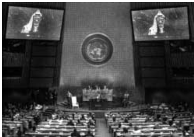
Jásir Arafat promlouvá k Valnému shromáždění OSN

Další ránu utrpěl Izrael v roce 1974, když Jásir Arafat pronesl projev k Valnému shromáždění a sklídl obrovské ovace. O rok později získala Organizace pro osvobození Palestiny stálé zastoupení v OSN a 10. listopadu 1975 schválilo Valné shromáždění poměrem hlasů 72 ku 35 (32 států se zdrželo) Rezoluci č. 3379, která označuje sionismus za formu rasismu a rasové diskriminace. Tato