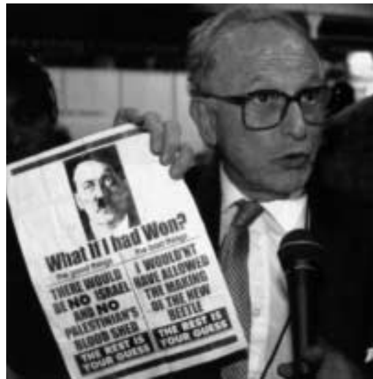
Světová konference OSN proti rasismu v jihoafrickém Durbanu: vice-prezident Světového židovského kongresu Lord Janner z Braunstone ukazuje novinářům protiizraelský leták