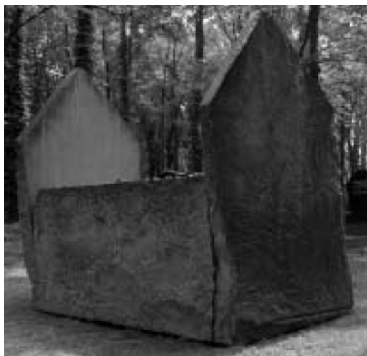
Tumba chránící přemístěné ostatky z Vladislavovy ulice

V prvé řadě jsme jediným pražským židovským hřbitovem, kde se dosud pohřbívá. Péče o hřbitov znamená starost o více než deset hektarů zeleně, která tvoří klidný a pietní rámec tisícům jednotlivých hrobů i rodinných hrobek. Převzal jsem hřbitov, na kterém byl podepsán půlstoletý nezáměr totalitního režimu o židovské objekty, a dodnes se s touto devastací potýkáme. Údržba hřbitova je prakticky z 85 % naší povinností, protože vzhledem k následkům šoa byla přerušena obvyklá generační péče o hroby. K tomu se přidalo i několik poválečných emigračních vln a ve