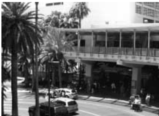
Slavný hotel Flamingo v Las Vegas

Za okny hotelu Flamingo bylo suché pouštní horko kolem 45°C, zatímco uvnitř probíhaly paralelně v osmi sálech po celý den přednášky a workshopy. V pětidenní