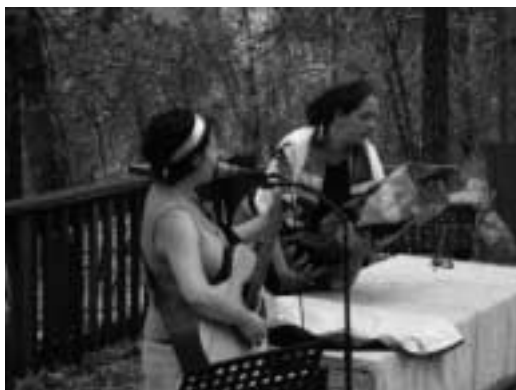
Součástí progresivních bohoslužeb může být hra na varhany nebo jiné hudební nástroje.

Špatné pochopení této skutečnosti je někdy výsledkem historických okolností. Mnozí australští a novozélandští židé přišli ze střední a východní Evropy, kde koncepce synagogy jako štiblu byla zvlášť silná a jakákoliv odchylka se zdála divná a bylo na ni nahlíženo jako na chukat-gojim , napodobování nežidovských zvyků.