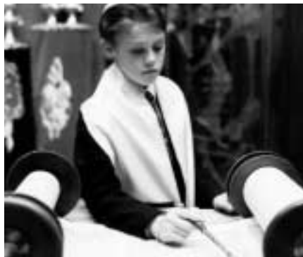
Tóra je centrem židovského života kdekoli na světě...

Některým může náboženská různorodost progresivních Židů sugerovat myšlenku, že si každý vybere jen to, co se mu líbí a vytvoří si svůj vlastní libovolný mix. Skutečnost je ovšem taková, že uznáním náboženské diverzity sjednocujeme ty Židy, kte-