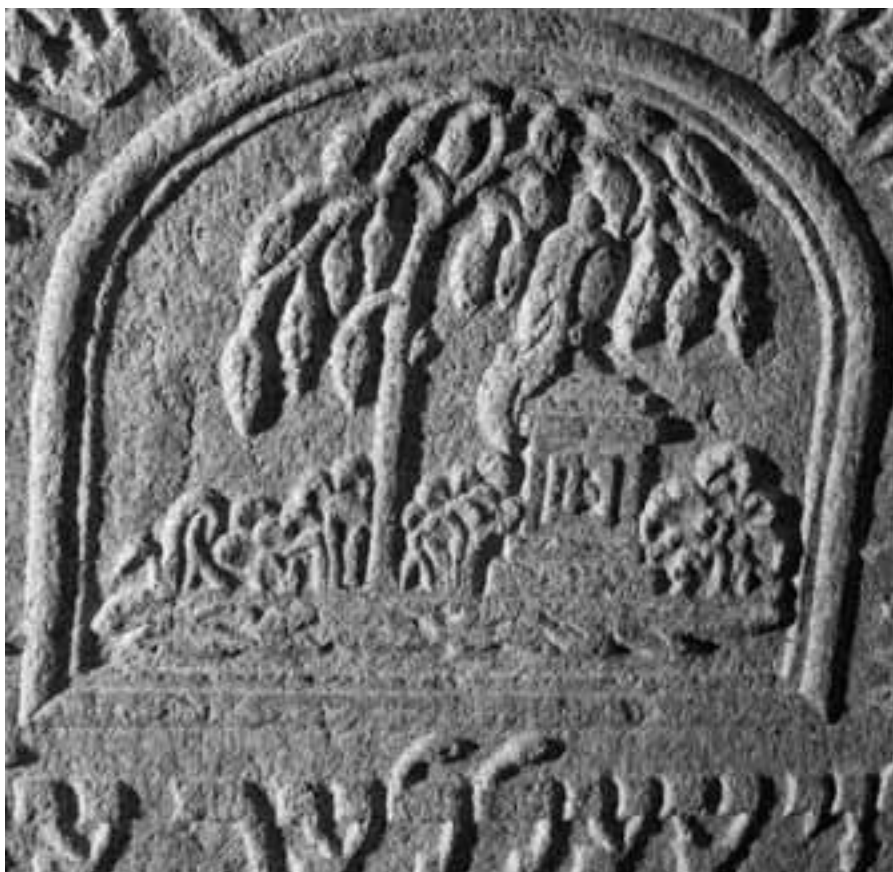
Obr. 4: Radenín, okres Tábor, židovský hřbitov, náhrobek Leviho Tellera, 1849, detail

► z 60. let 19. století a jejich nositeli bývají muži. Zajímavostí je zobrazení smutečního stromu na náhrobcích členů rodiny Schönbaum v Myslkovicích, které symbolizuje přijetí zesnulého, obr. 2.