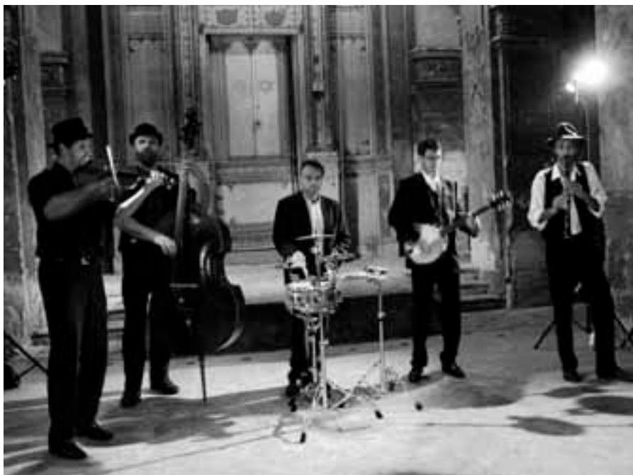
Klezmerové kapele Trombenik to vždycky „šlape“

Kischonovu povídku, které dodal svým nenapodobitelným tónem ještě další dramatické dimenze. Hudební kreace Jirky Stivína není nutné popisovat. Zahrál nejenom sólově, ale také společně s dalšími muzikanty a dokázal krátkými „poznámkami“ své flétny improvizovaně komentovat i další vystoupení.