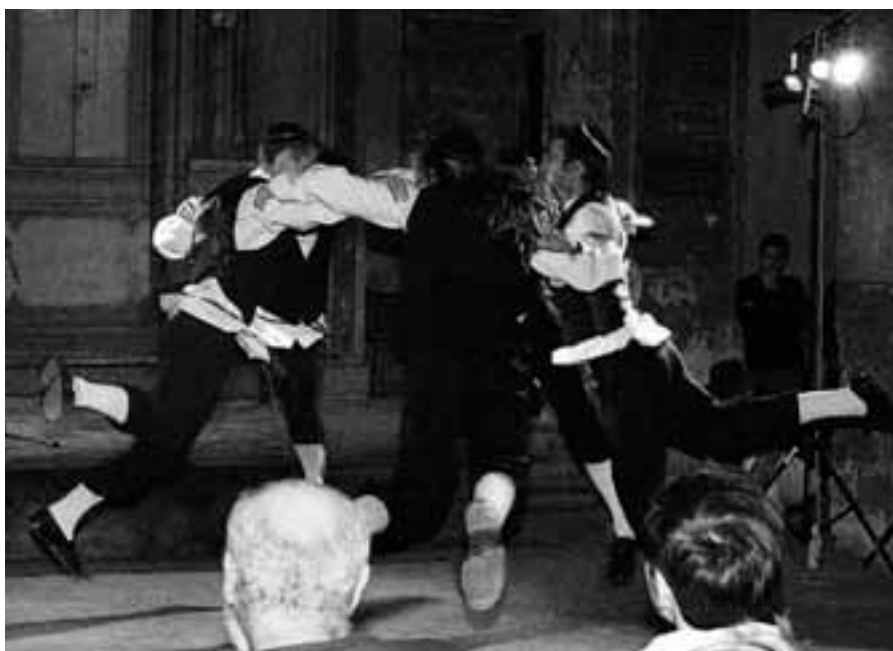
Tanečníci přináší na jeviště mládí, temperament a radost z pohybu