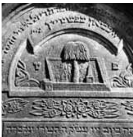
Obr. 5: Luže, okres Chrudim, židovský hřbitov, náhrobek Rejzl Epsteinové, 1866, detail

► z 60. let 19. století a jejich nositeli bývají muži. Zajímavostí je zobrazení smutečního stromu na náhrobcích členů rodiny Schönbaum v Myslkovicích, které symbolizuje přijetí zesnulého, obr. 2.