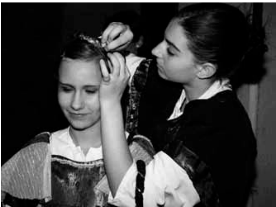
Mladé tanečnice se připravují na vystoupení