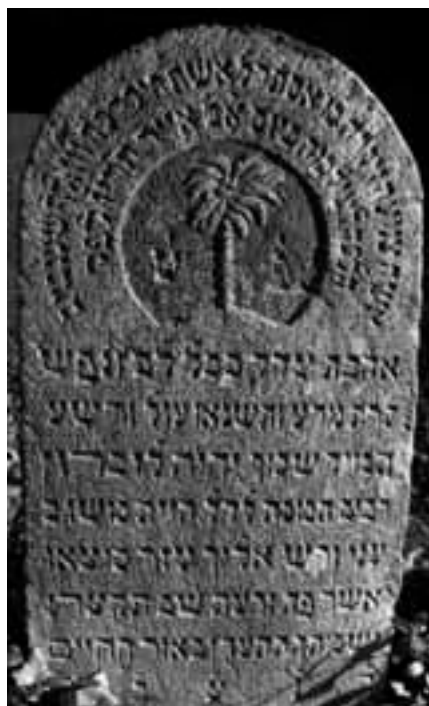
Obr. 2: Myslkovice, okres Tábor, židovský hřbitov, náhrobek Esterl, ženy Wolfa Schönbauma, 1857, detail

Smuteční strom alon bachut je, kromě levitského a kohenského znamení a Davidovy hvězdy, nejděle doloženým výtvarným motivem výzdoby židovských náhrobků na našem území. Je totiž jedním z mála symbolů používaných ve výzdobě židovských sepulkralií po druhé světové válce. Včetně nápisu, který jej určuje, se objevuje na několika náhrobcích v Liberci (1946).