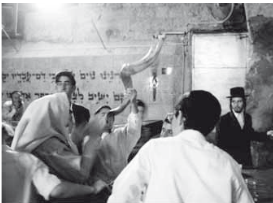
Troubení na šofar

však ještě více udivilo, byl druhý den. Protože se Židovky postily, zůstalo v hrnci jídlo, kterého se po celý Jom kipur nikdo nedotkl i přes to, že byl hlad, a bývalo zvykem ukrást