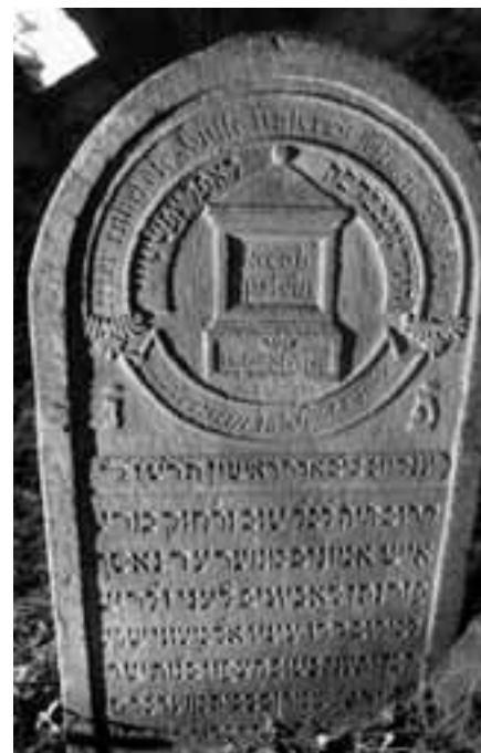
Obr. 6: Babčice, okres Tábor, židovský hřbitov, náhrobek Kopla Epsteina, 1856

Ve východních Čechách najdeme na náhrobcích zobrazené velmi honosné a monumentální reliéfy náhrobků (zmiňované náhrobky z Vamberku a Hroubovic). Stylizované a jednoduše provedené náznaky náhrobků jsou zobrazeny na starém hřbitově v Kolíně (Gunpl, syn Azriela 1838) a na hřbitově Radobyl u Kamýku nad Vltavou (Hirš, syn Meira, 1840).