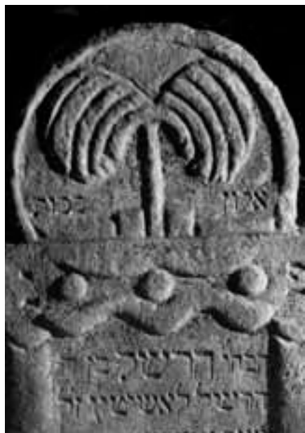
Obr. 1: Mikulov, okres Břeclav, židovský hřbitov, náhrobek Heršla, syna Heršla Loschütze, 1866, detail

Dub pláče se stal symbolem pro projevy smutku a zobrazení smutečního stromu bylo pro výzdobu náhrobků příhodné. Skutečnost, že toto zobrazení vychází ze židovské biblické tradice, dokládá hebrejský nápis alon bachut , kterým je v některých případech motiv označen. Za nejstarší zobrazení na našem území je možné považovat stylizo-