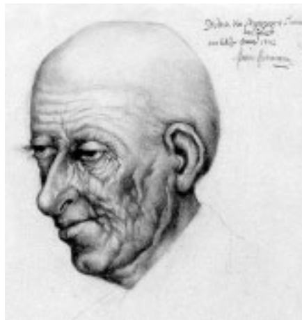
Stoletý stařec, studie k postavě Ahashvera, tužka, Terežín 1943

Poklidnému životu učiní konec 15. březen