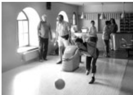
Bowling je i záležitostí společenskou