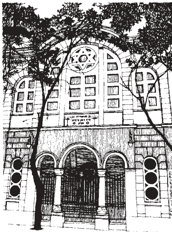
V řecké Soluni žili Židé dlouhá staletí.

ské hlubiny, v nichž se to hemží žraloky a jinými dravými rybami a nikdo se v nich nezachrání. Co nás dělí od těch nebezpečných mořských hlubin? Několik dřevěných prken nazývajících se lodí!? A co když se parník začne naráz potápět, co