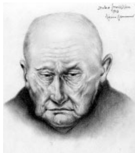
Studie františkána, tužka, Terežín 1943

Terezínským ghettem a peklem východních lágrů prošly stovky významných umělců. Jména židovských hudebníků, spisovatelů, básníků, herců i výtvarníků známe a jejich díla si vážíme. Mnoho umělecky nadaných lidí však zahynulo bez jediné