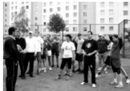
Nástup k volejbalovému klání