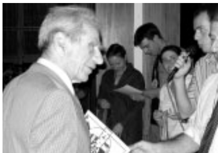
Autor textu při předávání diplomů