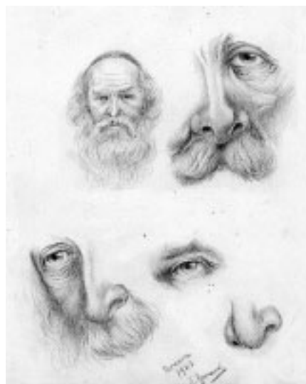
Studie k postavě Ahashvera – detaily, tužka, Terežín 1943